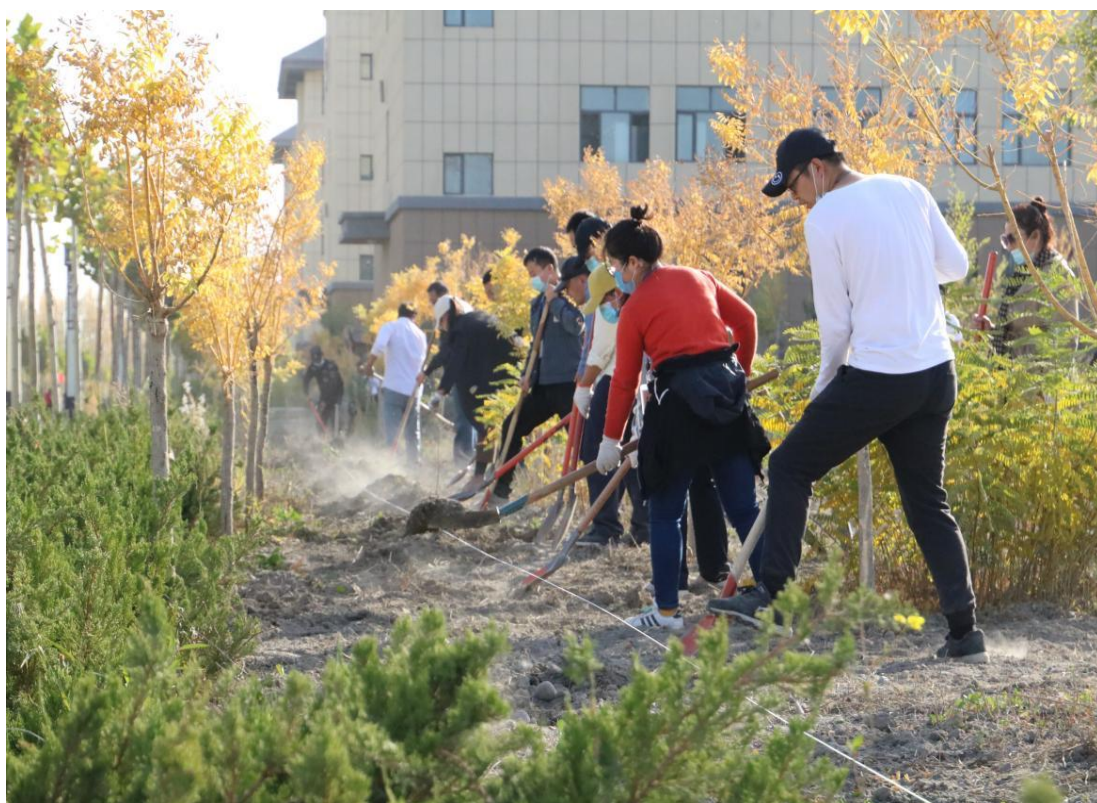
图 4 田间施肥