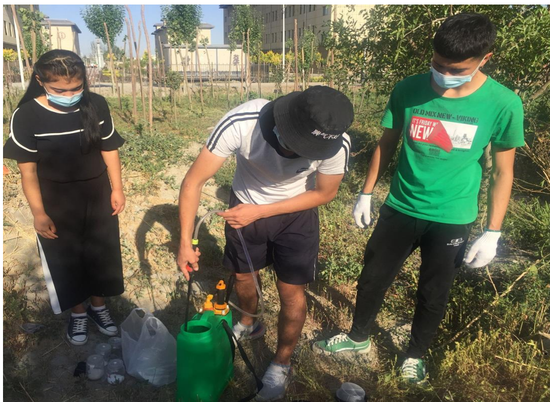
图 5 病虫害防治