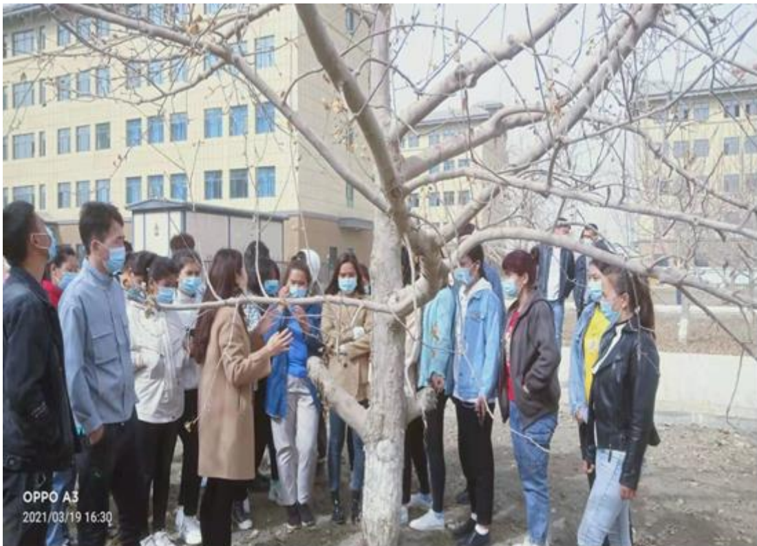
图 2 园中园果树识别