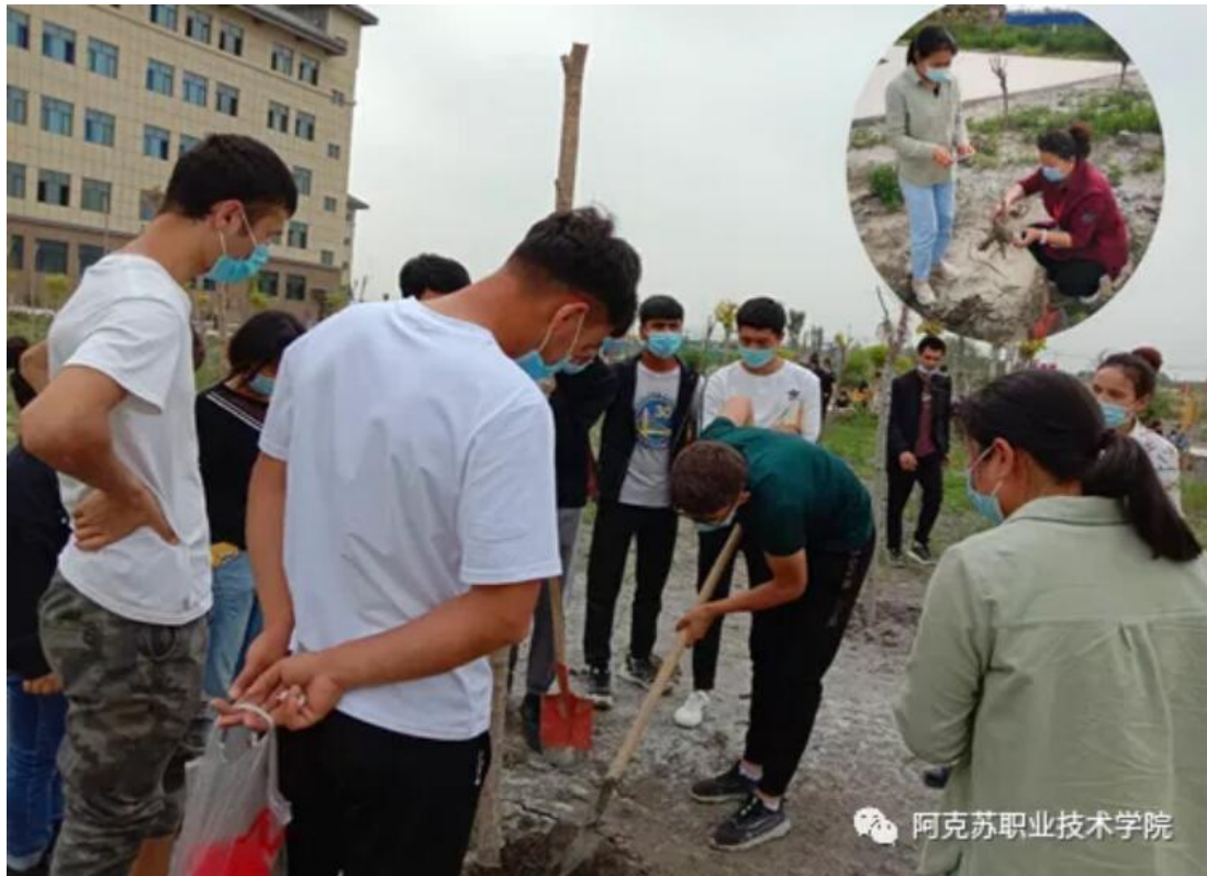
图 7 老师带领学生调查果树死亡率