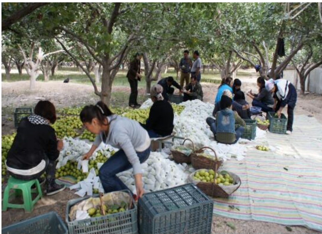
图 8 梨果采收及处理技术