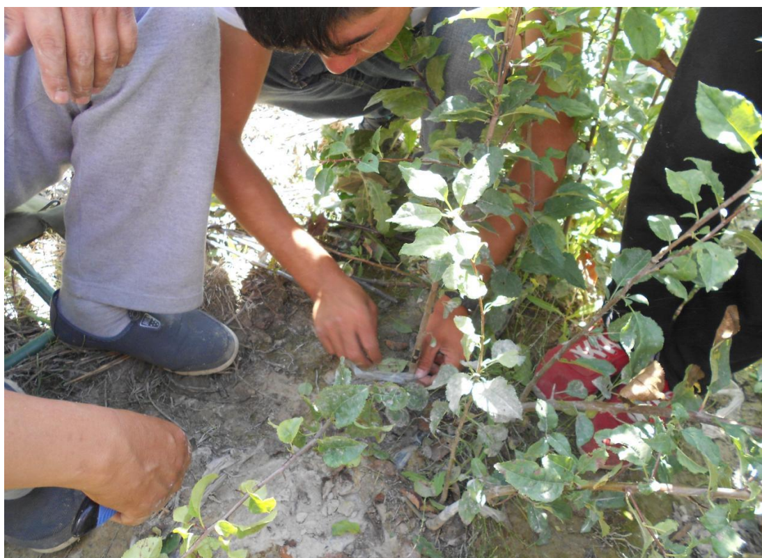
图 6 核桃林里学习核桃嫁接技术