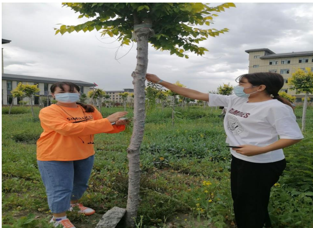
图 3 定制建园