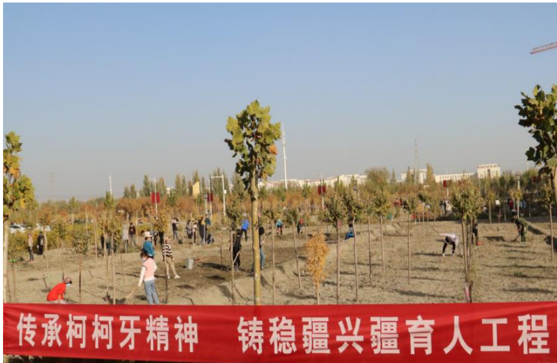
图 1 开展劳动教育，浸育柯柯牙精神